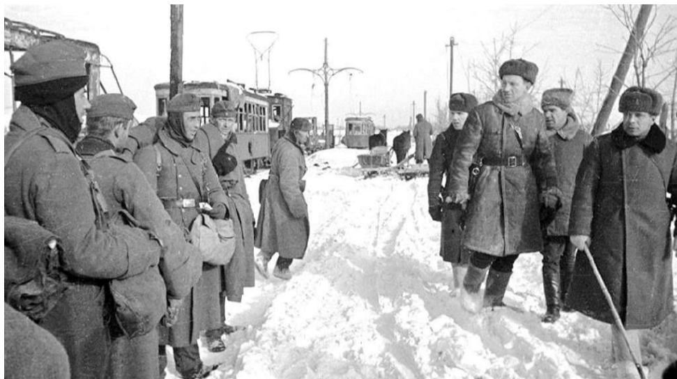
Советские офицеры проходят мимо немецких пленных. Второй справа – командующий 62-й армией генерал-лейтенант Василий Чуйков.

2 февраля после массированных артиллерийских и авиационных ударов капитулировала северная группа немецких войск под командованием командира 11-го армейского