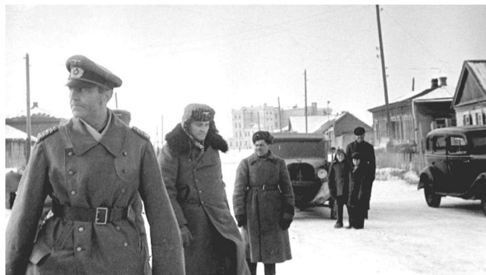
Командующий 6-й немецкой армией фельдмаршал Фридрих Паулюс, взятый в плен советскими войсками.